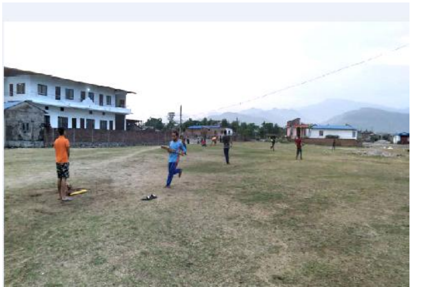
हेला खेल । उदयपुर सदरमुकाम गाईघाटमा क्रिकेट खेलमैदान नहुँदा क्रिकेट खेलाडीहरु खाली रहेको जग्गा खोजेर क्रिकेट खेल्नु पर्ने बाध्यता छ । पुरानो गाईघाटको बुद्धचोकको खाली जग्गामा क्रिकेट खेल्दै स्थानीय खेलाडीहरु ।