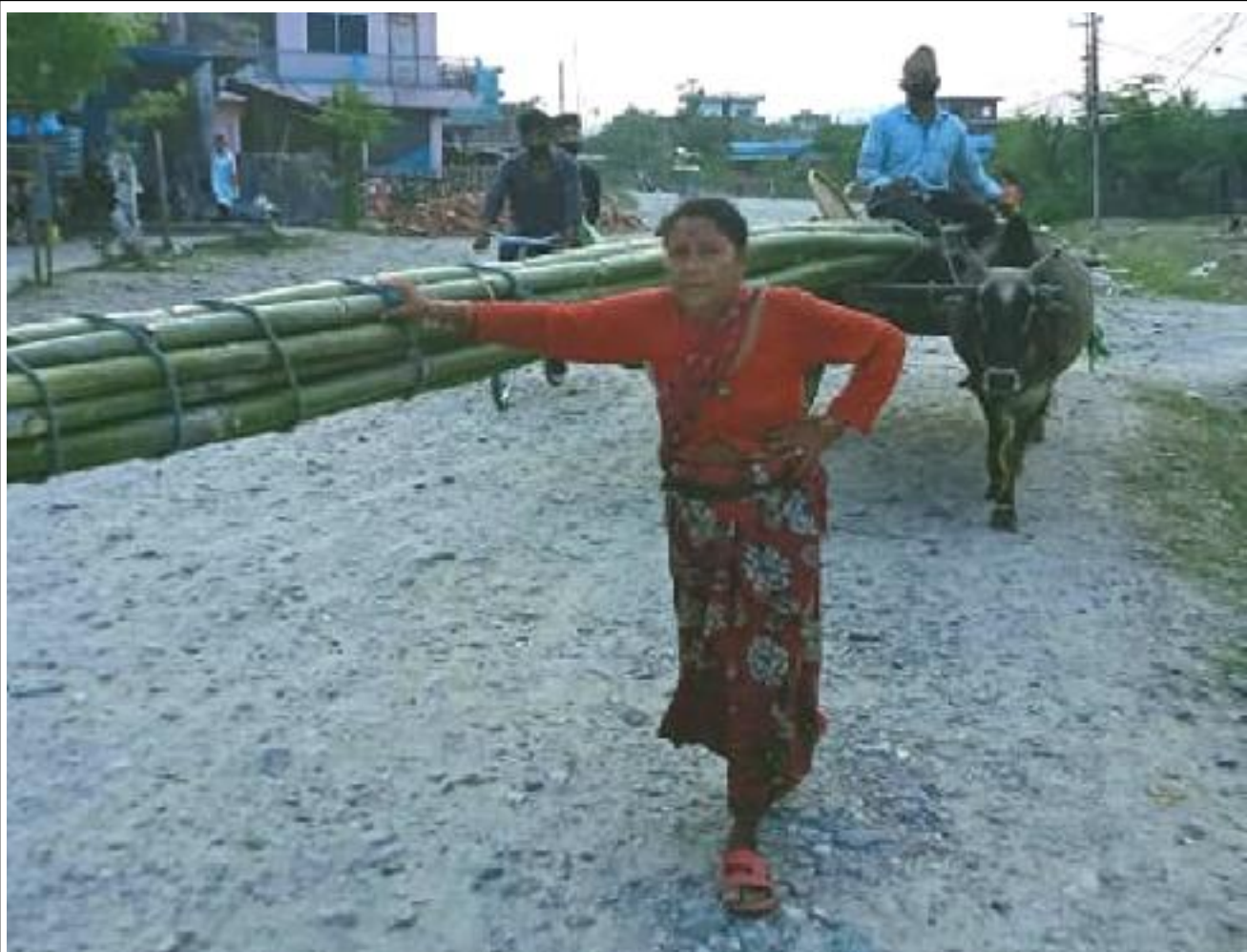
बुढेसकालको साहारा । उदयपुर त्रियुगा नगरपालिका १ जोगिदहका एक वृद्ध दम्पती आफुले उत्पादन गरेको बाँस सदरमुकाम गाईघाट बजारमा गोरुगाडामा बोकाएर बेच्न आउँदै।

नोट: रु २०,०००/- भन्दा माथिको बिलमा न्यून अतिवृद्धि न्य नैडिनेछ।