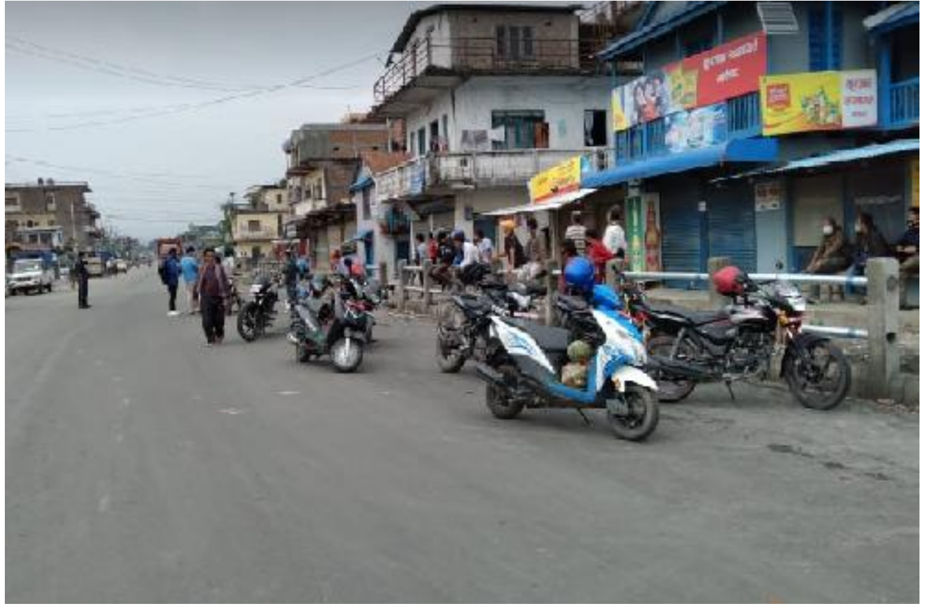
प्रहरी सक्रियता । गाईघाटको पुरानो गाईघाटमा एउटा मोटरसाइकलमा दुई जना चढेर हिडेका यात्रुहरुको दुई पाङ्ग्रे सवारीसाधान प्रहरीले नियन्त्रणमा लिदै । कोभिडका कारण गाईघाटको चोक चोकमा प्रहरीको सक्रियता बढेको छ । तस्बिर - मुलुकी ।